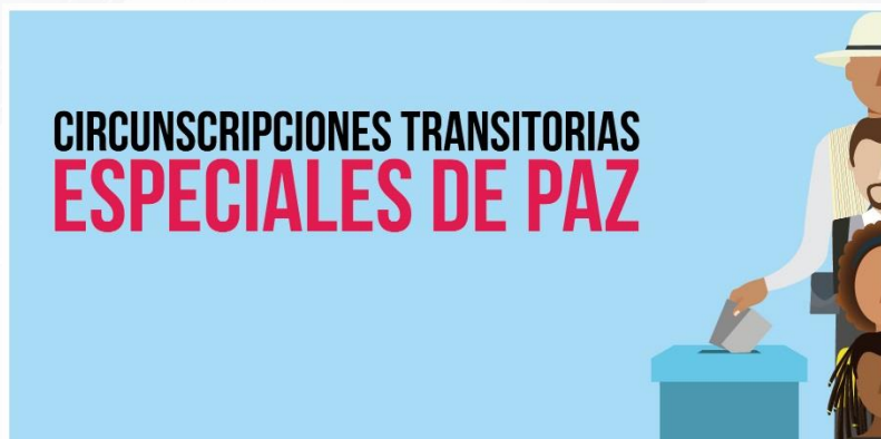
Imagen 3. Circunscripciones Transitorias Especiales de Paz.