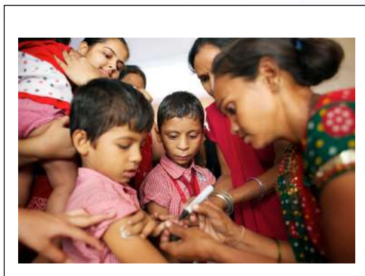
Imagen 4.