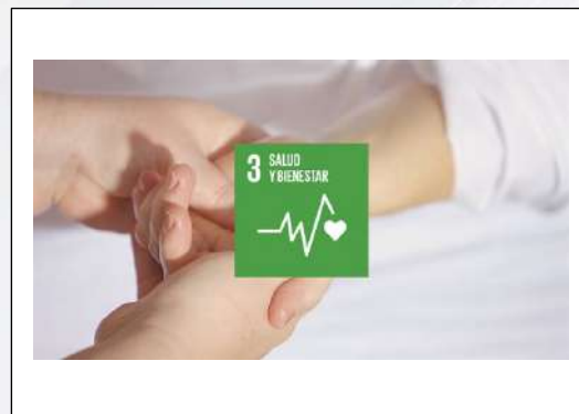
Imagen 3.