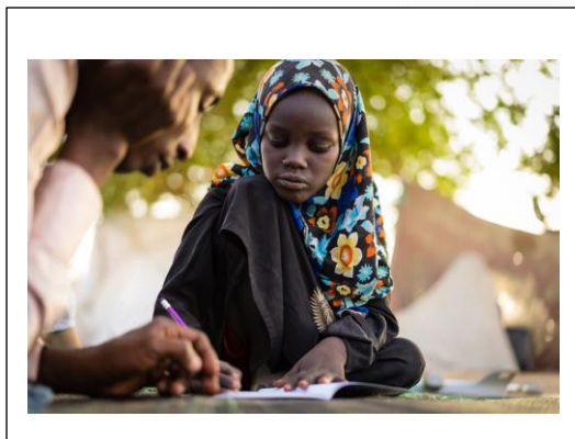
Imagen 4.