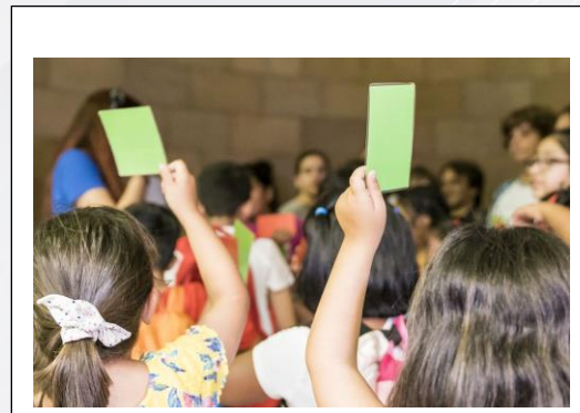
Imagen 3.